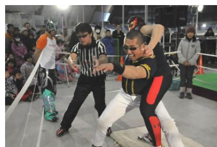
↑ 正規軍のピンチには近づくロープ