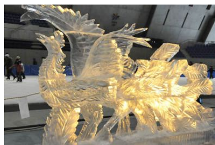
↑ ハイレベルな彫刻がたくさん