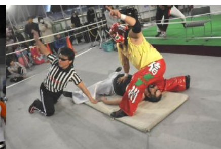
↑ 寒い中、熱気に包まれた会場