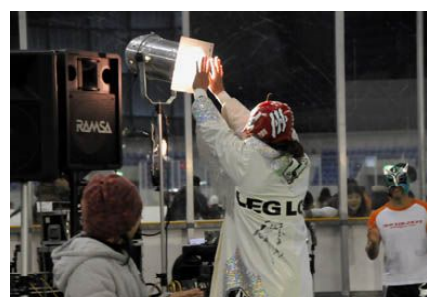
↑ 照明で暖をとる無茶

2月11日に行われた『氷の彫刻展マッチ』。リンクや氷彫刻が融けないように、会場の気温は外よりも低くなっている。そんな中で行われたゴムひもマッチ。試合後にはチン様が、またまた女性からのプレゼントをゲット。手編みで、何とSWFと編み込まれている!喜んで頭に巻いていたチン様だが、首に巻くネットクウォーマーであることが後に判明した。