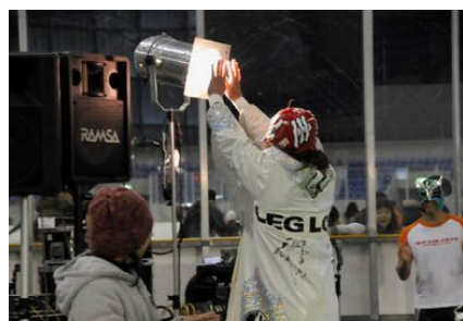
↑ 照明で暖をとる無茶

2月11日に行われた『氷の彫刻展マッチ』。リンクや氷彫刻が融けないように、会場の気温は外よりも低くなっている。そんな中で行われたゴムひもマッチ。試合後にはチン様が、またまた女性からのプレゼントをゲット。手編みで、何とSWFと編み込まれている!喜んで頭に巻いていたチン様だが、首に巻くネットクウォーマーであることが後に判明した。