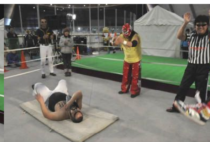
↑ 放置プレイされるチン様