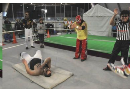
↑ 放置プレイされるチン様