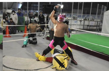
↑ 祝! 復活のPONTA