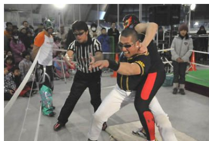
↑ 正規軍のピンチには近づくロープ