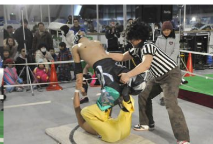
↑ 弓矢固め (アシスト付き)